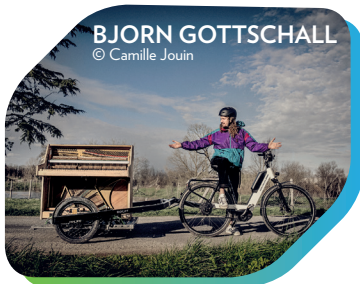
BJORN GOTTSCHALL