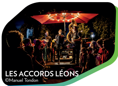
LES ACCORDS LÉONS