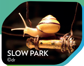
SLOW PARK