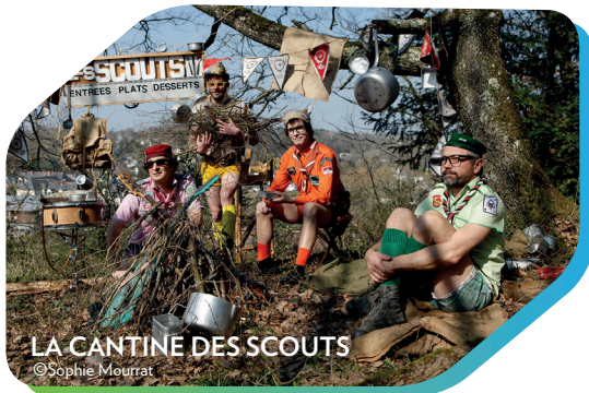
LA CANTINE DES SCOUTS