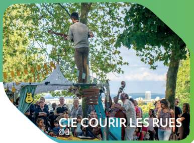
CIE COURIR LES RUES