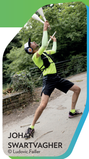
JOHAN SWARTVAGHER