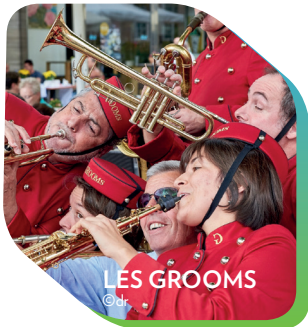
LES GROOMS ©dr